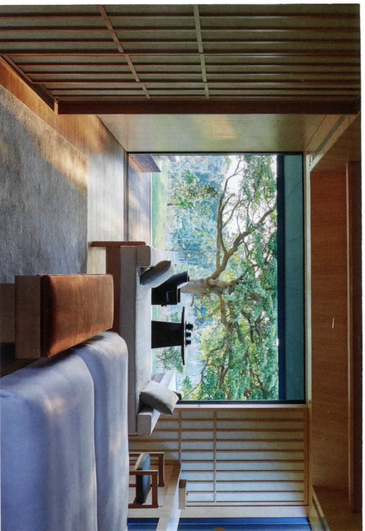
Sopra: una delle 24 suite dell'Amannemu resort, tutte con vasca termale privata. Sotto: un bungalow del GoldenEye resort, sulla costa settentrionale della Giamaica.

di Maria Teresa, sono un valore aggiunto che vale la pena di non farsi sfuggire.